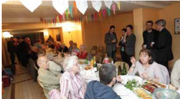
Au quai Barbier à Epinal...

Ce RDV annuel, permet non seulement de rompre l'isolement des personnes seules et âgées, mais il est aussi synonyme de proximité et de solidarité : « mieux connaître ses voisins, c'est aussi mieux les comprendre ».